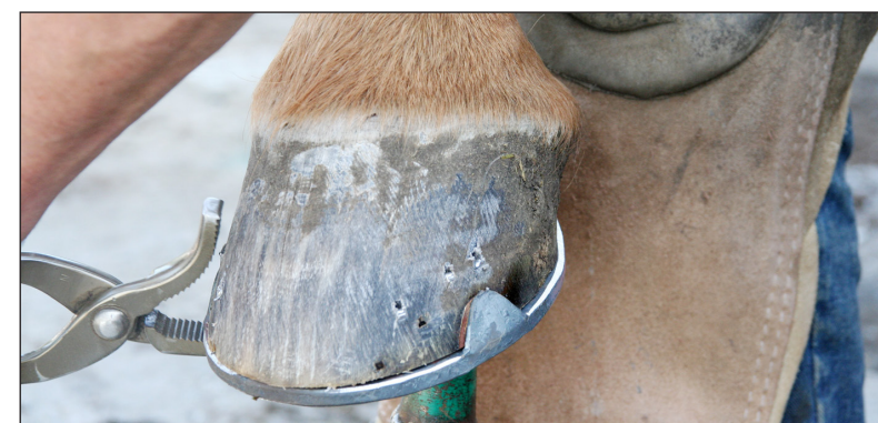
Kotkaus lukitsee naulan kavioon. Vaihe viimeistellään kotkauspihdeillä.