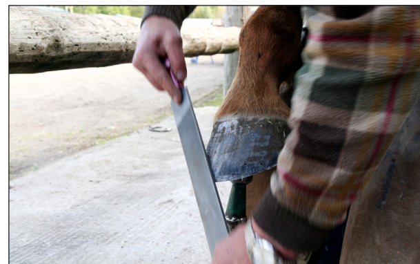
Pajari tekee raspilla tilaa kenkän varvaspyöritykselle.