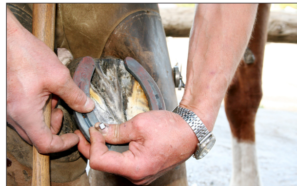
Kenkä kiinnitetään yleensä kuudella naulalla.