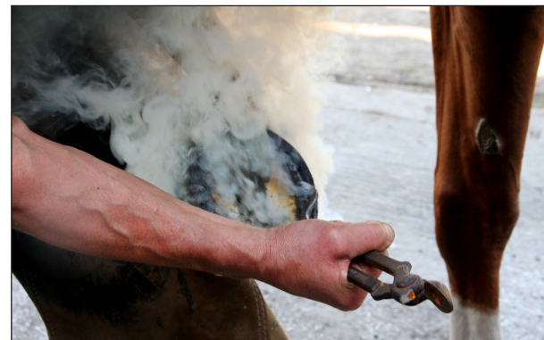
Kuuma kenkä asennetaan hetkeksi kavioon.