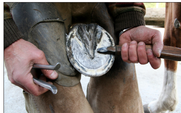
Kaviota vuolaan ja säteen urat avataan.