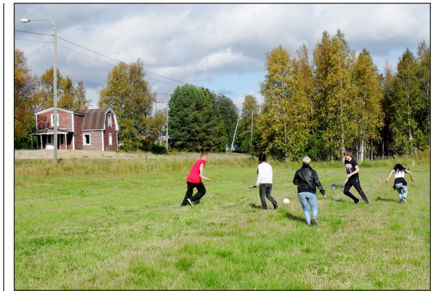
Pohjantähti-opistolla on yhdessä tekemisen riemua.